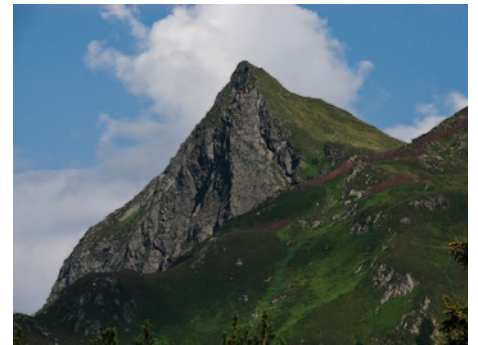
Von der Bergstation aus gesehen

Für den direkten Rückweg zur Bergstation folgen Sie nun einfach der Beschilderung (Bergstation Sonnenkopfbahn), dieser Weg schlängelt sich, etwas höher gelegen als der Hinweg, durch die reizvolle Hochmoorlandschaft . Oder Sie schlagen den selben Weg wie beim Aufstieg ein, dann folgen Sie zunächst dem Aufstiegsweg und dann der Beschilderung "Thüringer Schafalpe".