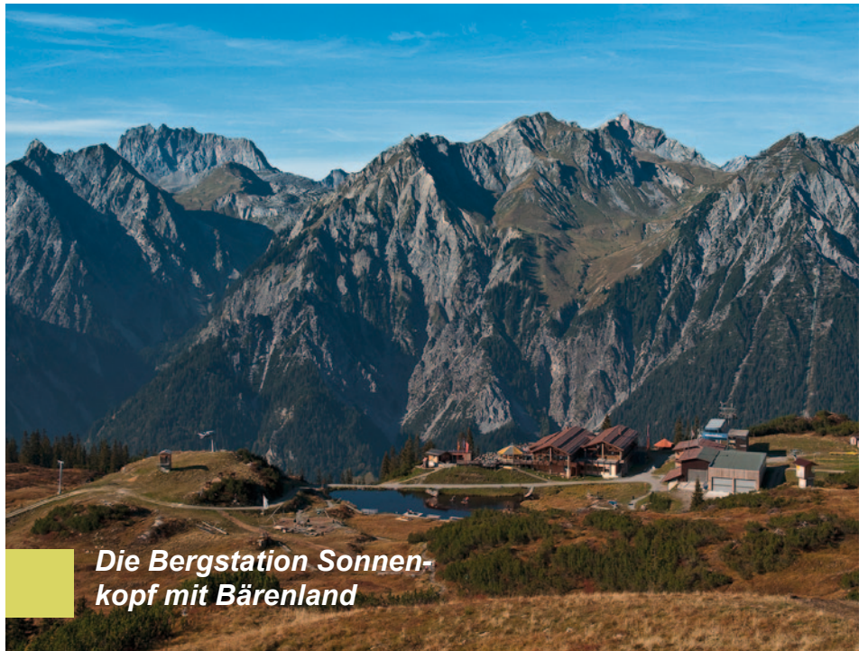
Die Bergstation Sonnenkopf mit Bärenland

Wenn Sie wieder hinunter gestiegen sind zum Burtschasattel, können Sie sich, je nach Tageszeit, für den Rückweg entscheiden (die letzte Bahn fährt im Sommer um 16.30 Uhr talwärts) oder eine "Zusatzrunde" um den Berg drehen. Hierfür steigen Sie zur Thüringer Schafalpe ab (ca. 45 min) und wandern von dort um den Berg herum wieder zurück oder auch talwärts hinunter bis zur Talstation (das zieht sich allerdings – großer Höhenunterschied!).