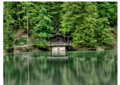
Staufensee. Unten rechts: Alploch

derung ausdehnen und zur Bergstation der Karrenseilbahn aufsteigen. Wenn Sie aber wegen der Schlucht gekommen sind, sollen Sie das Alploch nicht verpassen. Folgen Sie also dem Weg am Staufensee entlang bis zur Brücke und dem Kiosk am anderen Ende des Sees. Dort kann man eine Pause einlegen, bevor man dem Weg weiter folgt und, rechts abbiegend, in Richtung Alploch wandert (beschildert). Gleich am Eingang dieser Schlucht wird's eng und der ganze erste Teil des Weges besteht aus Holzstegen, die an den Felswänden angebracht sind. Gewaltige Felswände und zahlreiche kleine Wasserfälle bieten ein sehr schönes und beeindruckendes Naturschauspiel. Am Ende der Schlucht gehen die Steige wieder in einen Natur/Schotterweg über, der uns ansteigend aus der Schlucht hinauf bis nach Ebnit und zum Naturdenkmal "Kirchle" führt. Das ist eine Klamm, in der man gewaltige,