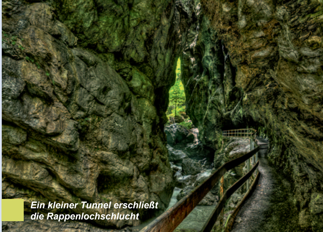
Ein kleiner Tunnel erschließt die Rappenlochschlucht

derung ausdehnen und zur Bergstation der Karrenseilbahn aufsteigen. Wenn Sie aber wegen der Schlucht gekommen sind, sollen Sie das Alploch nicht verpassen. Folgen Sie also dem Weg am Staufensee entlang bis zur Brücke und dem Kiosk am anderen Ende des Sees. Dort kann man eine Pause einlegen, bevor man dem Weg weiter folgt und, rechts abbiegend, in Richtung Alploch wandert (beschildert). Gleich am Eingang dieser Schlucht wird's eng und der ganze erste Teil des Weges besteht aus Holzstegen, die an den Felswänden angebracht sind. Gewaltige Felswände und zahlreiche kleine Wasserfälle bieten ein sehr schönes und beeindruckendes Naturschauspiel. Am Ende der Schlucht gehen die Steige wieder in einen Natur/Schotterweg über, der uns ansteigend aus der Schlucht hinauf bis nach Ebnit und zum Naturdenkmal "Kirchle" führt. Das ist eine Klamm, in der man gewaltige,