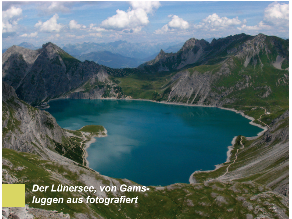
Der Lünersee, von Gamsluggen aus fotografiert

den zur Schesaplana hochsteigen (nur für Geübte, schwindelfreie und gut ausgerüstete Wanderer, blau-weiß). Wer wie ich harmlosere Absichten (und nicht die nötige Kondition) hat, kann auch noch ein Stück weit Richtung Gamsluggen weitergehen (ca. 30 min), wo sich ein schöner Ausblick über den See eröffnet (Tipp für Fotografen, siehe oben!). Würde man dort weitergehen (Beschilderung beachten), könnte man über Gamsluggen zum Gafalljoch gelangen und von dort wieder zum See hinuntersteigen. Es handelt sich hier um einen blau-weiß markierten Bergsteig mit leichten Kletterpartien.