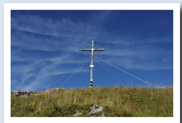
Gipfelkreuz der Gurtisspitze