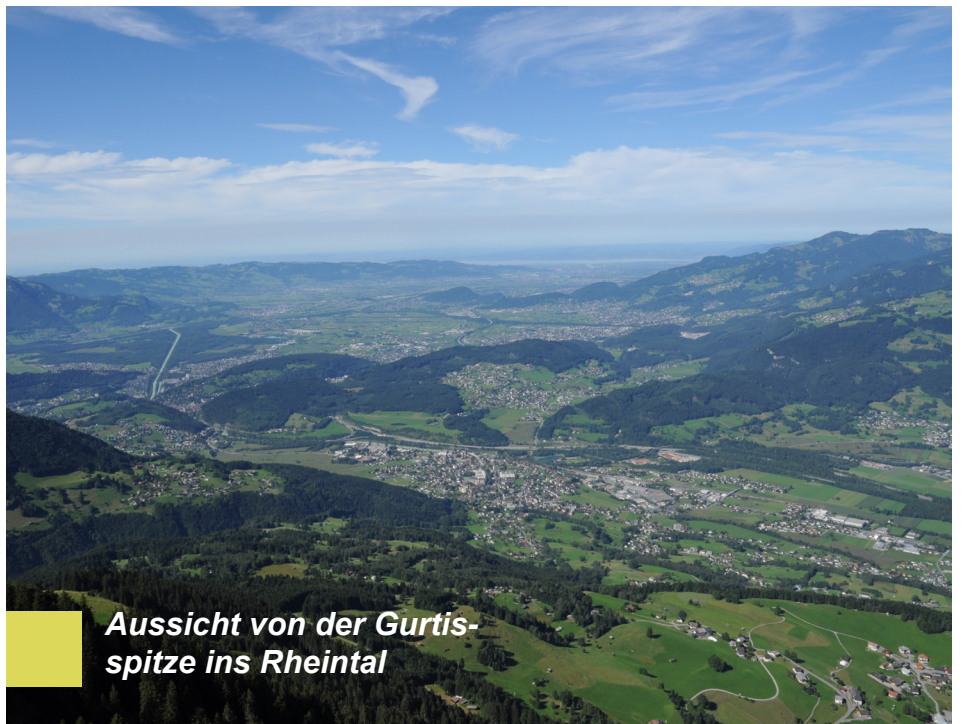
Aussicht von der Gurtisspitze ins Rheintal